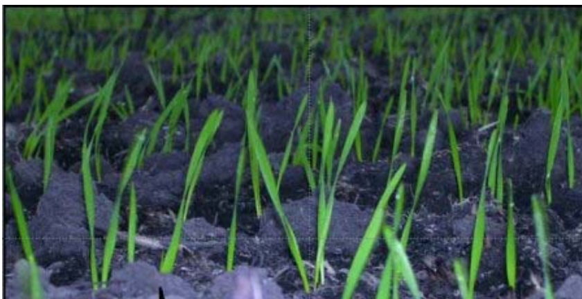
Planteo con distribuidor monograno

No se toman en consideración el poder germinativo, la pureza ni la eficiencia de implantación. Para el ejemplo anterior para una sembradora monograno la cantidad de semilla necesaria sería de 9 kg/ha. Para una siembra a 52,5 cm entre hileras estaríamos sembrando 13,5 semillas por metro lineal. Si aplicamos la fórmula perdemos las ventajas del planteo más preciso de las sembradoras monograno y nos apartamos de la densidad óptima recomendada por el semillero.