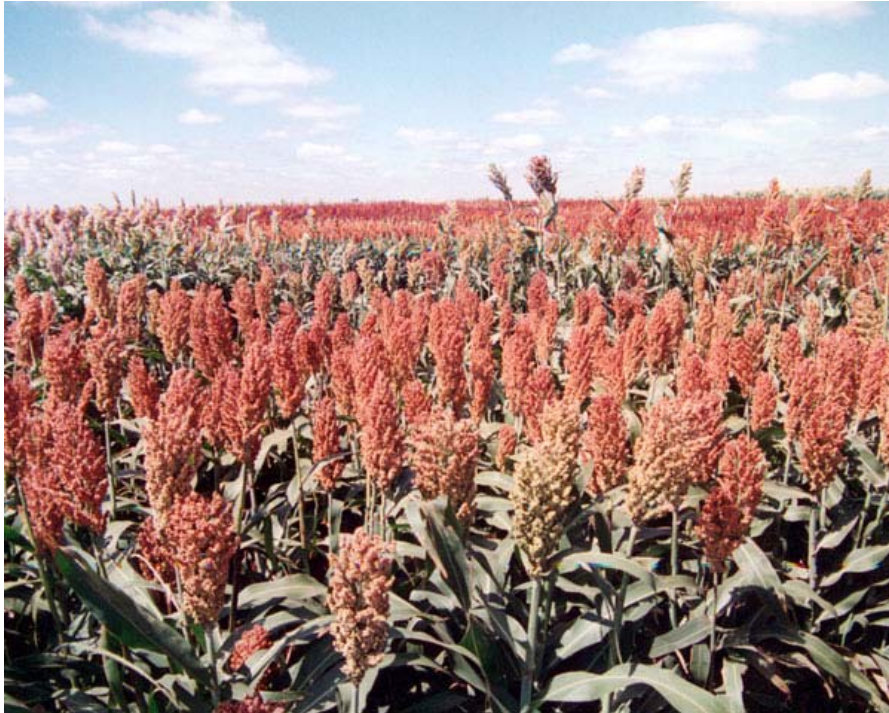
Se debe lograr uniformidad a la cosecha, en altura y madurez