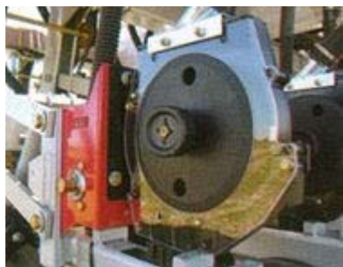
Dosificador de placa vertical VHB.