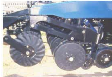
Sembradora Victor Juri con similar tren de siembra, penetra bien y no se atora.