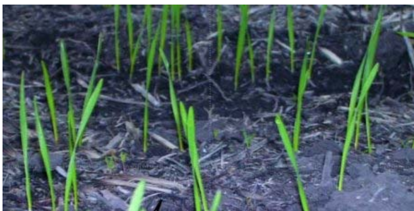
Planteo con distribuidor a chorrillo