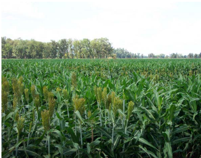
Distancia entre hileras y densidad en la línea óptimos

En general en Argentina las experiencias en lotes de productores indican que un espaciamiento entre surcos de aproximadamente 52 cm es el óptimo. En términos generales, cuanto menor sea el rendimiento ambiental a esperar, mayor debe ser la distancia entre surcos.