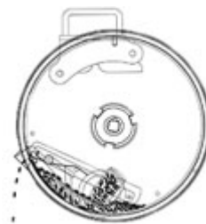
Placa y esquema de dosificador vertical Yomel