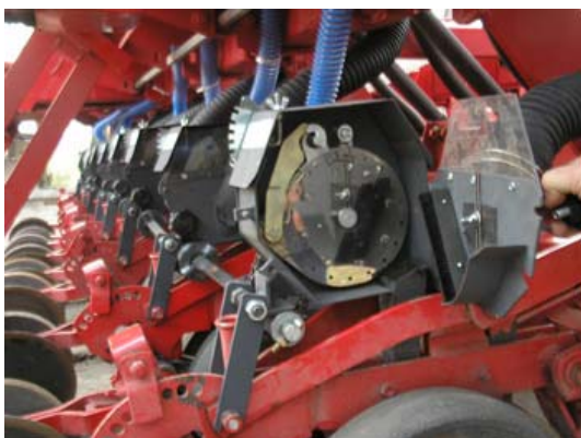
Dosificador neumático de tamaño reducido instalado en sembradora de grano fino