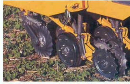
Tren de siembra original completo