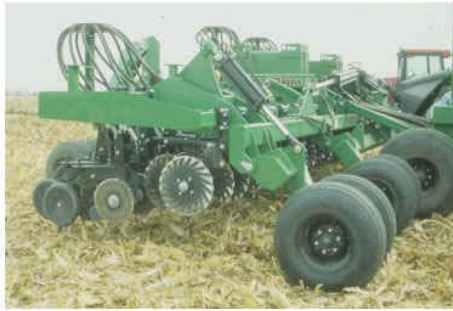
Sembradora tipo Air Drill con rueda trasera tapadora-limitadora de profundidad