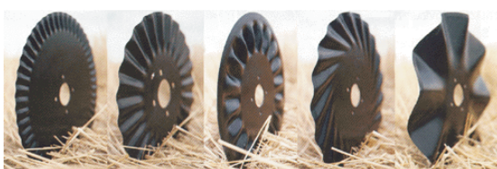
Rippled Wave Bubble Turbo Deep Fluted

Es preferible utilizar cuchillas de corte que produzcan mínimo movimiento del surco de manera para facilitar el trabajo de las ruedas tapadoras, las turbo para suelos más francos y las rippled para suelos más arcillosos pueden ser una buena elección. Se debe tener cuidado que la profundidad de trabajo sea la menor posible siempre que corte el rastrojo, ya que, sino condicionará la profundidad del abresurco. Incluso es posible sacar la cuchilla de corte en condiciones de escaso rastrojo en máquinas que tengan abresurcos del tipo doble disco descentrado. Otra forma de evitar un remoción excesiva es usando patines en la cuchilla de corte (ver figura).