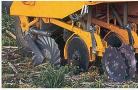
Tren de siembra modificado sin la rueda de control profundidad