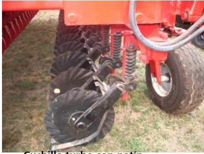
Cuchilla turbo con patín

El abresurco del tipo dobles discos iguales o descentrados es preferible al monodisco ya que proporciona un mejor control de profundidad situación clave para el sorgo. La presencia interior de una zapata o al menos de una lengüeta conformadora del fondo del surco resulta efectiva para optimizar la apertura del surco y la localización de las semillas y debe revisarse periódicamente su estado y posición.