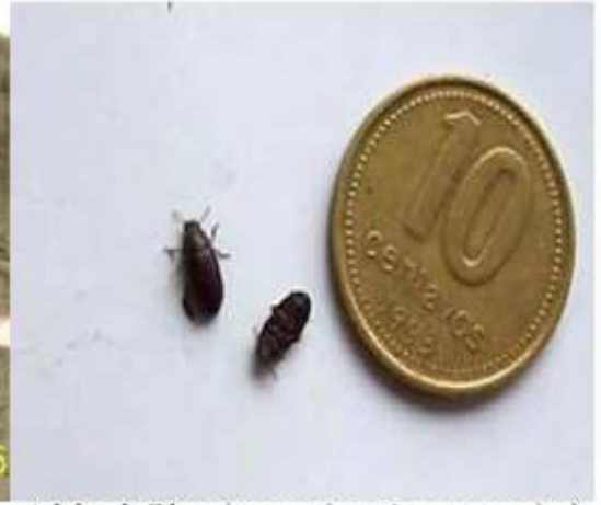
lesión observable 90 DDS, originada al estado de plántula Adulto de Blapstinus sp. (tamaño comparativo)