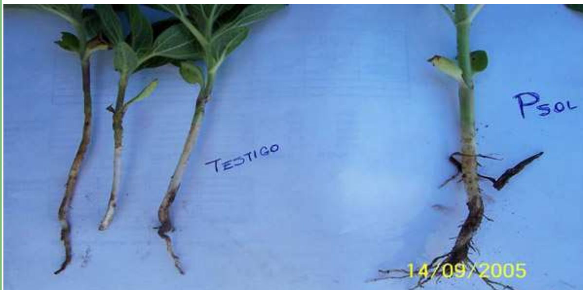
Girasol - campaña 05-06

Daño y retraso provocado por Blapstinus sp. (izq.) Vs. Efecto de tratamiento de semilla con PonchoSol (der.)