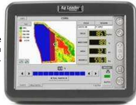
Figura 3. Pantalla del nuevo monitor Insight de AgLeader, mostrando la confección de un mapa de rendimiento en colores en tiempo real, superpuesto a un mapa de híbridos de Maíz.

La firma Ag Leader, también presenta en este monitor la tecnología de cableado Can bus, a veces llamada también cable inteligente, que a través de un solo cable comunica a todos los sensores del monitor, cada uno de los cuales envía su información con un identificador del tipo de dato. Además cada sensor es responsable de parte del procesamiento de la información que genera, liberando capacidad de la consola para otras funciones. Las ventajas de este sistema son la mayor simplicidad de cableado e instalación y de mayor importancia aún la posibilidad de agregar sensores sin la necesidad de agregar cableado ni reprogramaciones complejas de la consola.