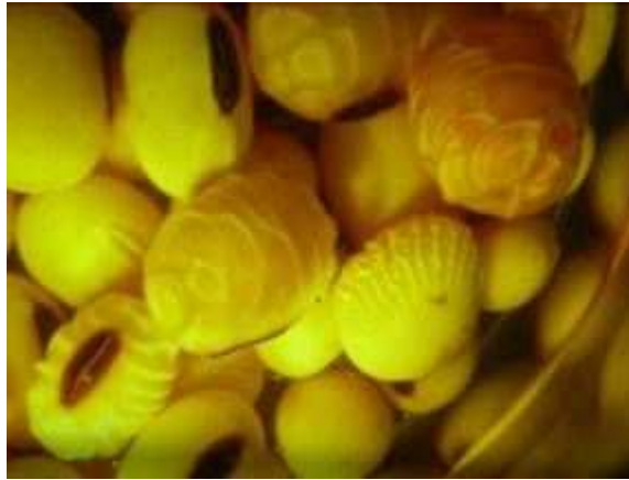
Figura 4. Detalle de semillas/granos hidratándose durante la Prueba de Hipoclorito. Fuente: Laboratorio de semillas del INTA Oliveros, 2005.

Fuente: Laboratorio de semillas del INTA Oliveros, 2005.