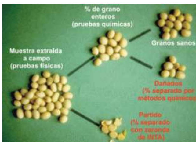
Figura 1. Daño mecánico en semillas de Soja. Fuente: INTA PRECOP, 2006.

Los métodos disponibles para evaluar calidad (daño mecánico), del grano obtenido por la cosechadora, se dividen en métodos físicos (para evaluar daño mecánico visible) y métodos químicos (para evaluar daño mecánico invisible) (Figura 1).