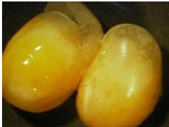
Figura 5. Semillas/granos de Soja hinchados dañados físicamente.