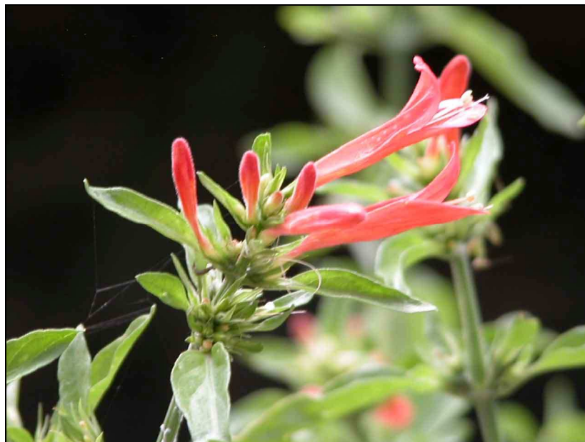
Fig. 1. Inflorescencia de D. tweediana