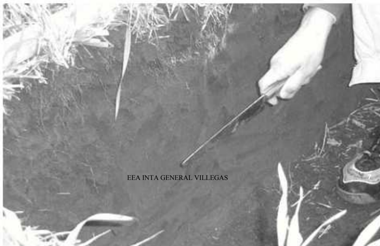
EEA INTA GENERAL VILLEGAS

Determinar las diferencias en estimaciones de susceptibilidad a la compactación de Molisoles a partir evaluaciones "in situ" o empleando muestras disturbadas de los suelos.